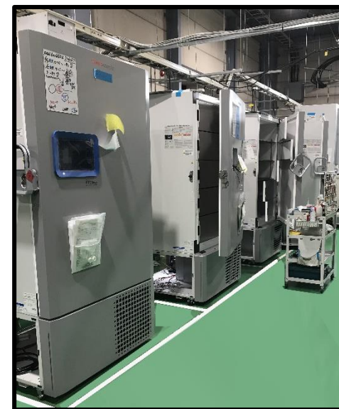
隣接する技術サービスセンター