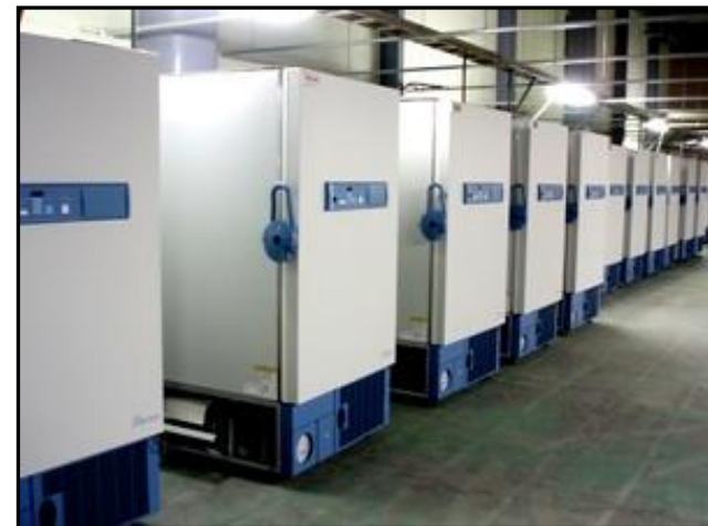
朝日サンプルバンクサービス室